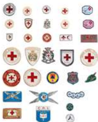
Art. CRI52 – SPILLE VARIE CRI