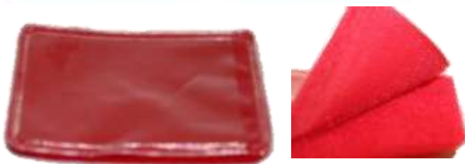
Art. CRI86 - PORTABADGE CON VELCRO