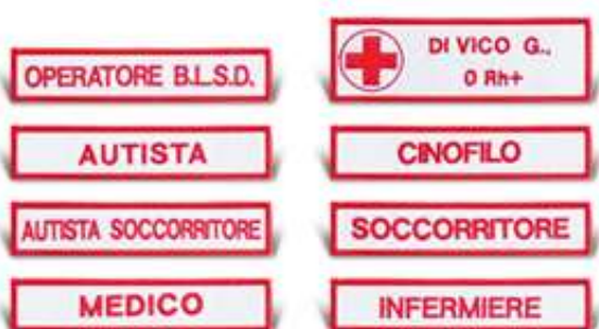
Art. PC18C – NOMINATIVI E SPECIALIZZAZIONI CON VELCRO