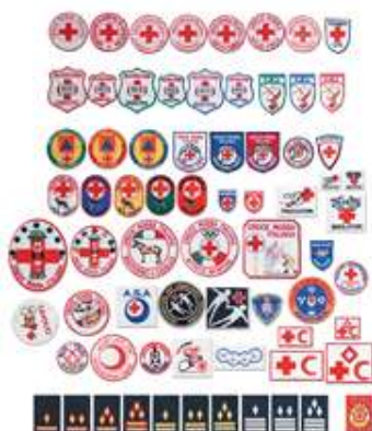
Art. CRI27 – RICAMI VARI CRI