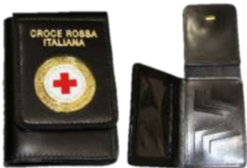
Art. CRI25 – PORTADOCUMENTI PELLE CON STEMMA